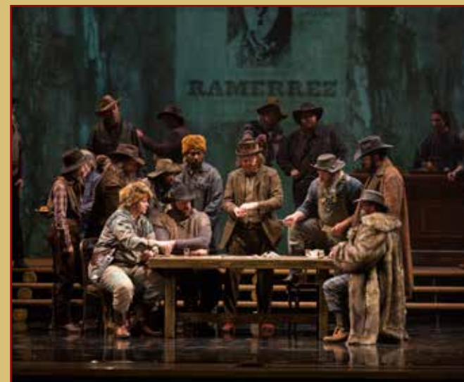
LA FANCIULLA DEL WEST