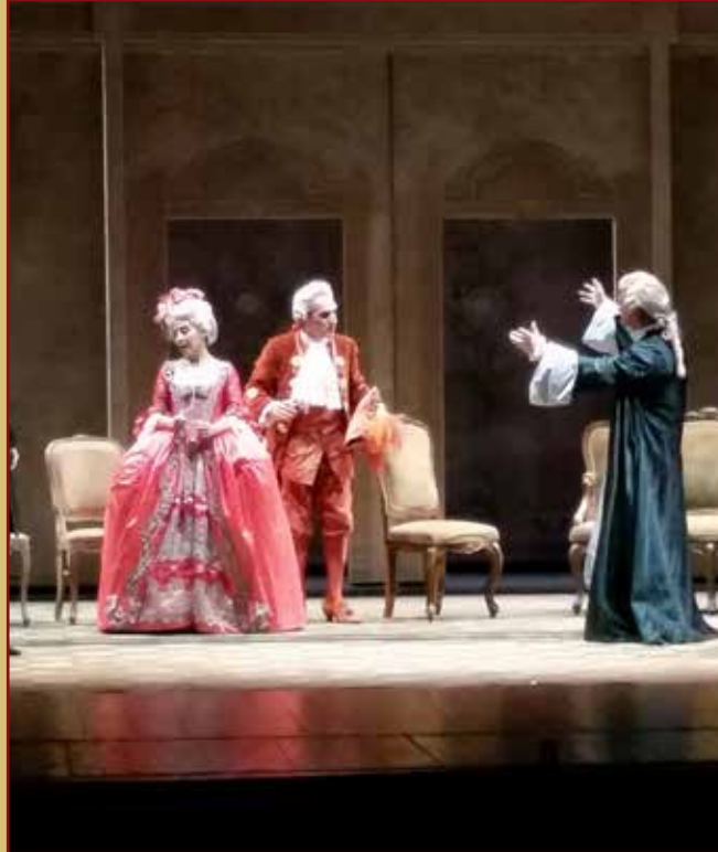
LE BARUFFE CHIOZOTTE