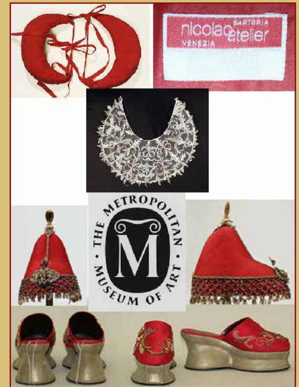
METROPOLITAN MUSEUM OF ART