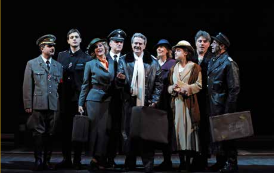
TO BE OR NOT TO BE