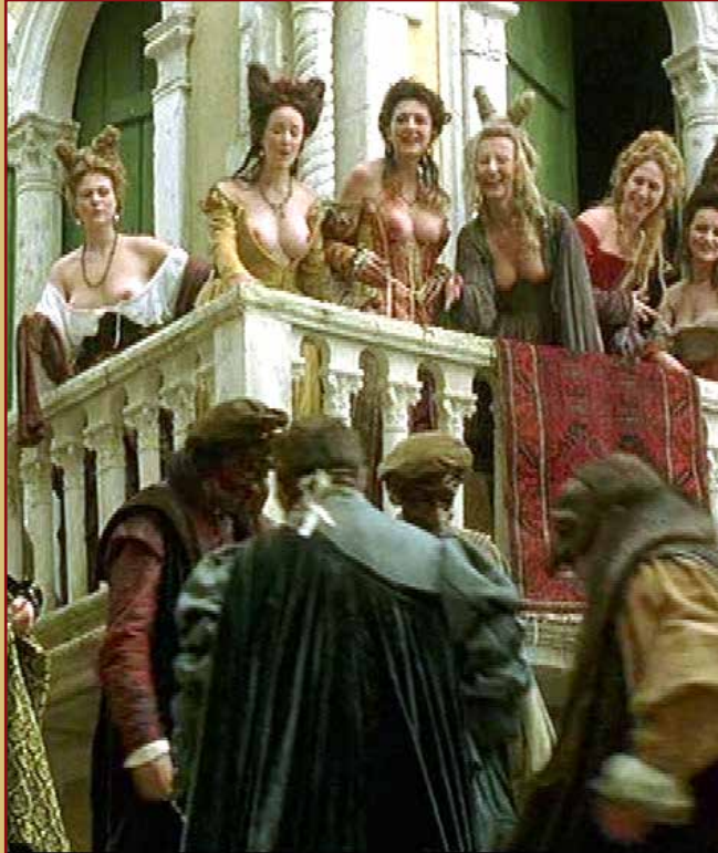
MERCHANT OF VENICE