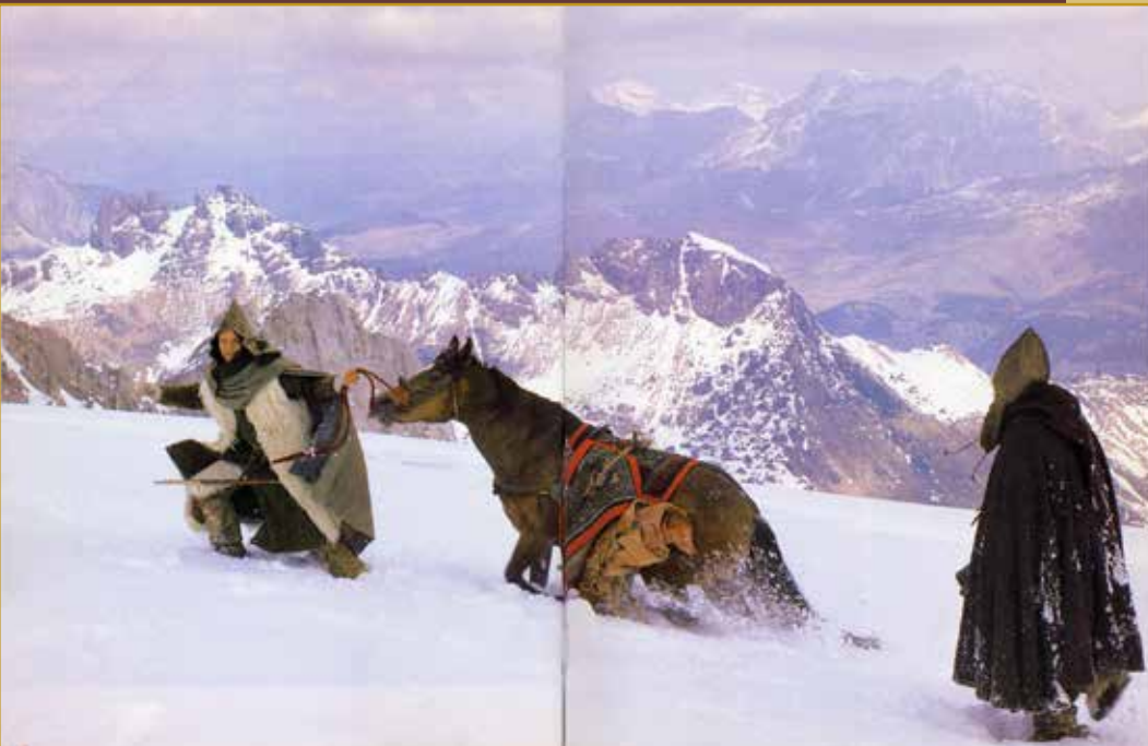
The Polo family that crosses the Hymalaiana chain (Nepal). Film "Marco Polo", G. Montaldo, Costumes E. Sabbatini- Making scenes and costumes second unit Tibetana - 1980

One of my first important experiences was the Film Marco Polo for which, as Enrico Sabbatini's assistant, I curated scenes and costumes for the second unit in Tibet. I lived through the Middle Ages dealing with the reconstruction of fabrics, wools mounted on dyed wools to obtain the fall and the grace that gave a precise idea and image of a period that seems simple but that, because of its geometry, complicates the cutting of the various garments overlapping.