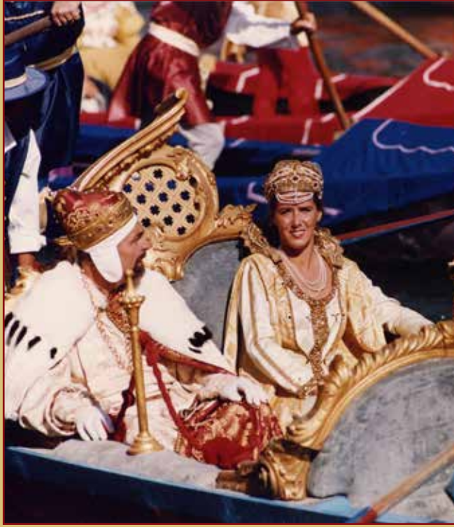
HISTORICAL REGATTA VENICE