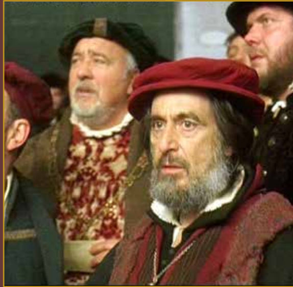
MERCHANT OF VENICE