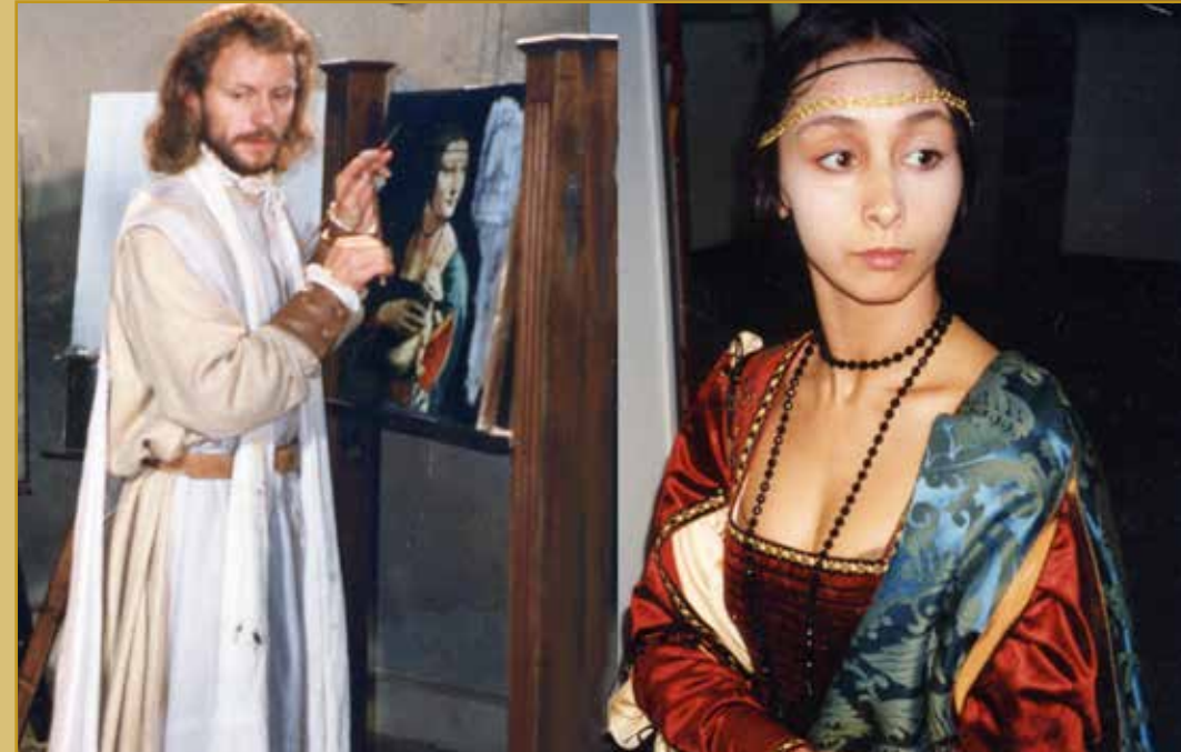
Scene of Leonardo while he portrays Cecilia Gallerani in the painting of the Lady with the Ermine, the costume in the foreground worn by the actress rebuilt from the painting.

An interesting historical recovery operation was carried out for the production of films by Devine Production for Canadian television: "Galileo" and "Leonardo da Vinci", for which original iconographic costumes were reconstructed, in particular the "Lady with an Ermine", "Ludovico il Moro". The Film Galileo was awarded with the Emmy prize for costumes.