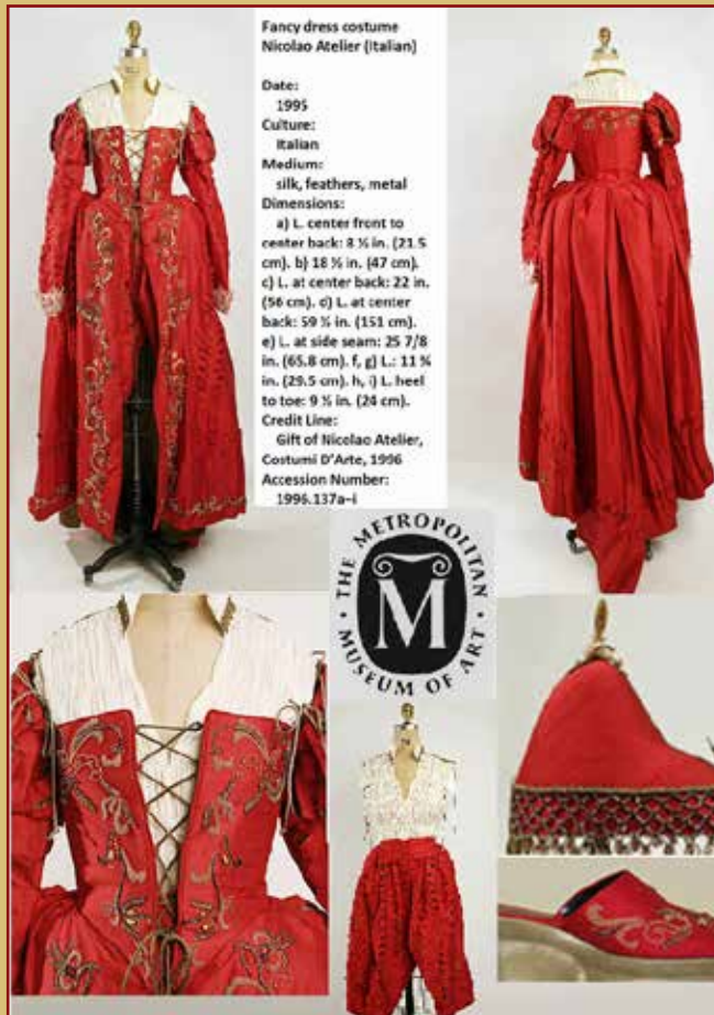
METROPOLITAN MUSEUM OF ART