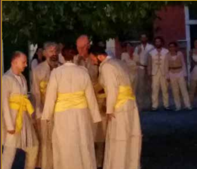
THE MERCHANT OF VENICE