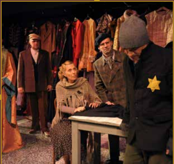
TO BE OR NOT TO BE