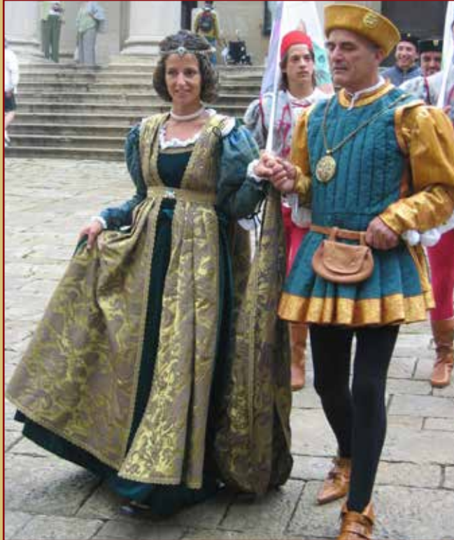
CROSSBOWMEN Republic of San Marino