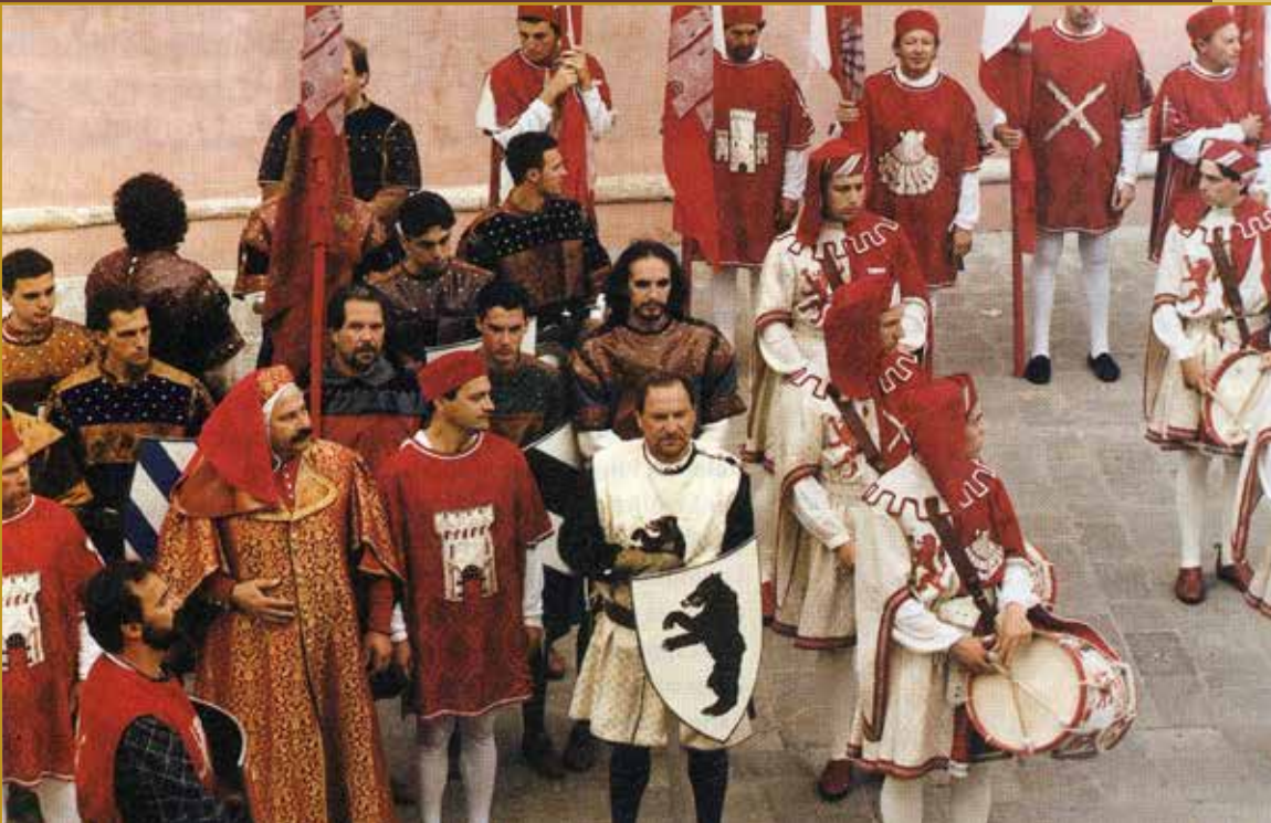
Detail of the "Palio delle Guerra di Chioggia" - La Marciliana. Podestà, bishops, drummers, swordsmen and two contenders men of arms - 1994