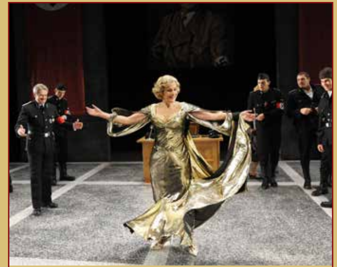
TO BE OR NOT TO BE