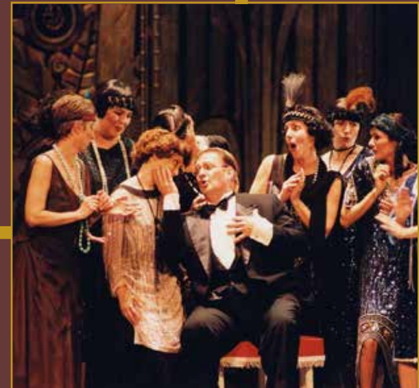
LADY BE GOOD