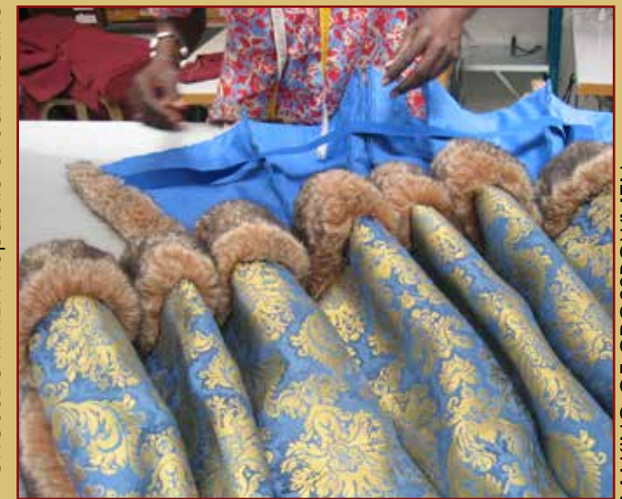
MAKING OF CROSSBOWMEN