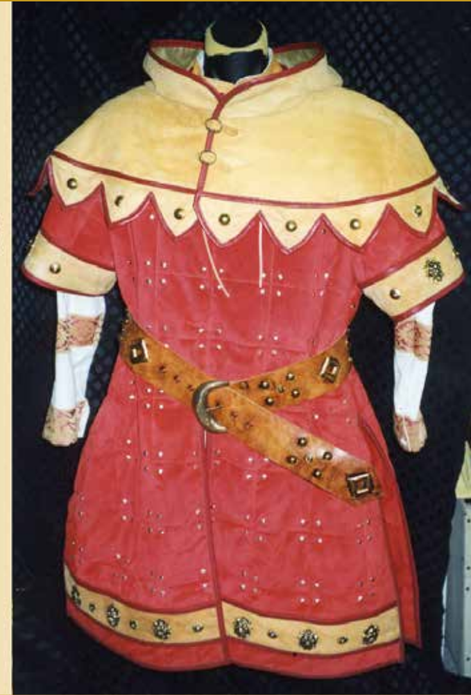
Sketch of S. Nordio for swordsmen and costume made of linen, leather and suede with small metal parts - Palio delle Guerra di Chioggia - La Marciliana - 1994