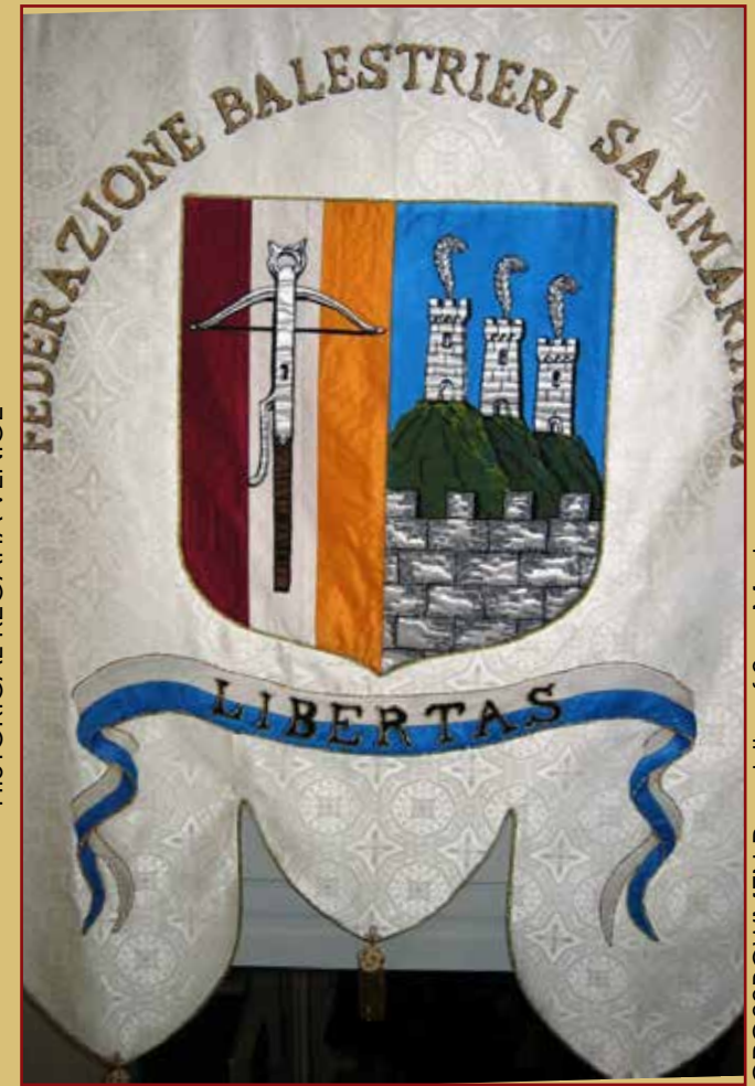
CROSSBOWMEN Republic of San Marino