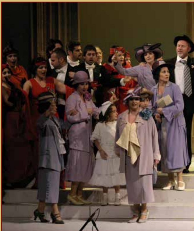
CAPELLO DI PAGLIA